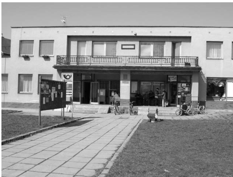
Obecní úřad Rosovice, duben 2005