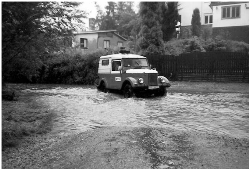
Srpen 2002, povodeň u chat Pod Sajovkou