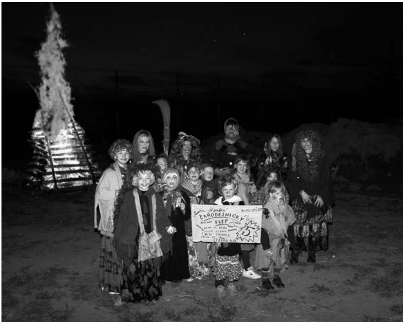
5. čarodějnický slet, 30. 4. 2005

K tradičním akcím již čtvrtý rok patří zejména Malý dětský vánoční koncert, pořádaný ve spolupráci se Základní školou a Mateřskou školou v Rosovicích v místním kostele společně s vánočním jarmarkem a dětskou soutěží o nejhezčí vánoční výrobek. Oblíbené jsou i výlety do příbramského aquaparku, kam děti mohou jet za odměnu za pomoc při úklidu obce. Každoročně se v místním hostinci uskutečňuje i dětský karneval