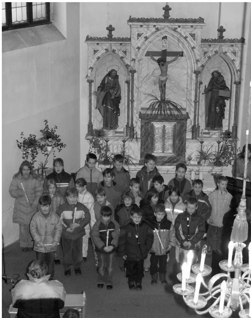
Vánoční koncert dětí, prosinec 2004

s bohatou tombolou, nebo děti mohou navštívit dvě akce, pořádané ke Dni dětí - divadelní představení či Podbrdský lesní víceboj, pořádaný ve spolupráci se sbory dobrovolných hasičů Holšiny a Rosovice.