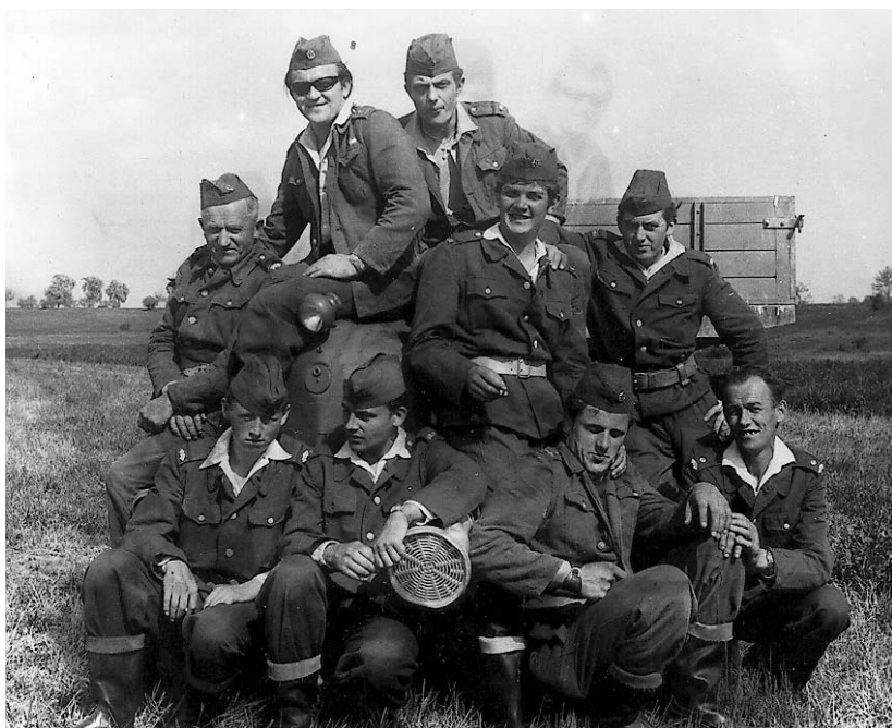
Sbor v roce 1966 -