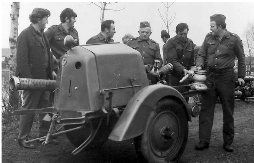
Hasičský sbor v šedesátých letech