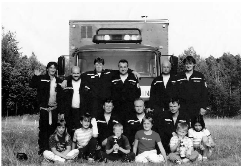
I. ročník Holšinského poháru, září 2004

a o dvacet let později už měl sbor 79 členů, v roce 1987 dokonce 83 členů (později se však jejich počet snižoval). Sbor byl členem 27. okrsku, který sdružoval sedm sborů: kromě Holšín ještě Rosovice, Bukovou, Pičín, Kotenčice, Suchodol a Občov.