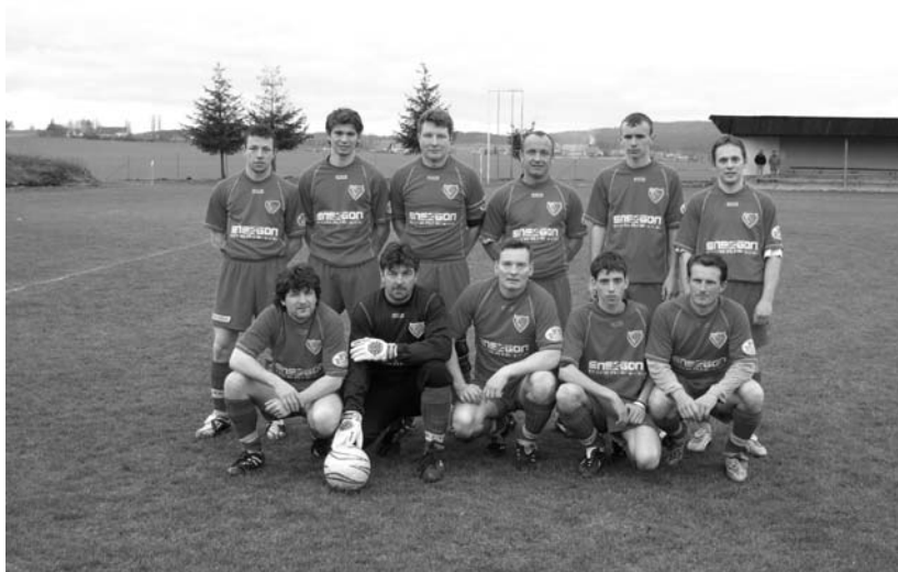
Mužstvo Sokola Rosovice, 10. 4. 2005