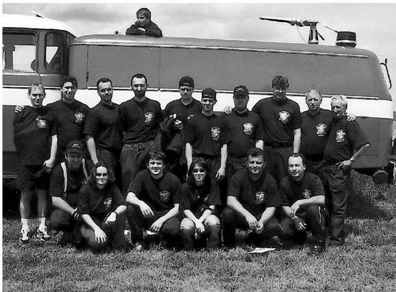
- a v roce 2004

V roce 1942 „hasiči sehráli “Tvrdé české palice”, Osvětová komise operetu „Cikánská krev“ a „Valčík panny Apolény“, z výtěžku zakoupeny dvě tabule pro školu...”