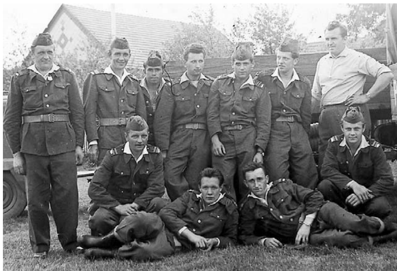
Sbor v šedesátých letech